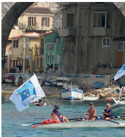
LES PLUS BELLES RANDONNÉES 2018 / ESCAPADE

Comme les navigateurs grecs, il y a 2600 ans, découvrons Marseille. Marseille, à dire vrai, on ne peut l'aimer qu'ainsi : en arrivant de la mer, comme Prodis, le phocéén. Au départ du vieux port, nous apercevrons la basilique Notre Dame de la Garde (la bonne mère) qui, de son promontoir millénaire protégeait les marseillais, les forts Saint-Jean et Saint-Nicolas conçus par Vauban et l'abbaye de Saint-Victor. Nous passerons ensuite au pied du Palais du Pharo offert par Napoléon III à l'impératrice Eugénie et nous devinerons la cathédrale de la Major pour effleurer le château d'Ifs et voir de nombreuses calanques.