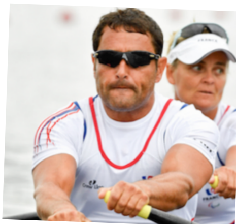
Stéphane TARDIEU Perle BOUGE

Championne du Monde Vice-Championne Paralympique 2012